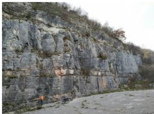
La falesia Tobia Zambon