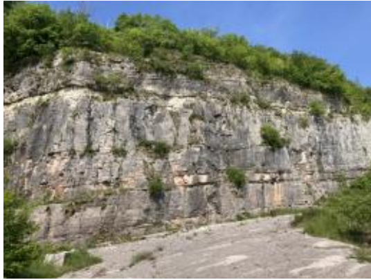
Parete Martina https://avevolevertigini.com/