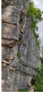
Tiro Fire Fox 6a Martina

https://avevolevertigini.com/2021/05/29..