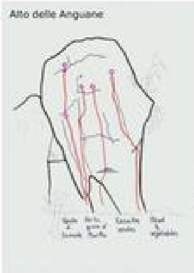
Alto delle Anguane